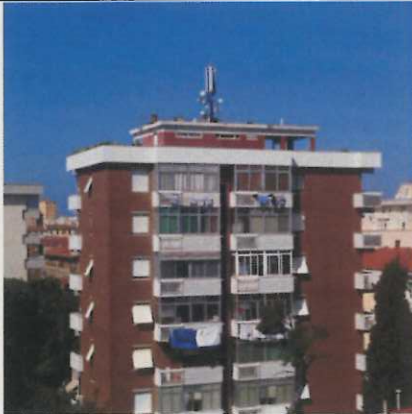
SRB Vodafone "Colline"