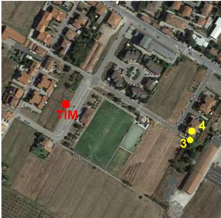
CARTOGRAFIA CON INDICAZIONE DELL'UBICAZIONE DEGLI IMPIANTI E DEI PUNTI DI MISURA